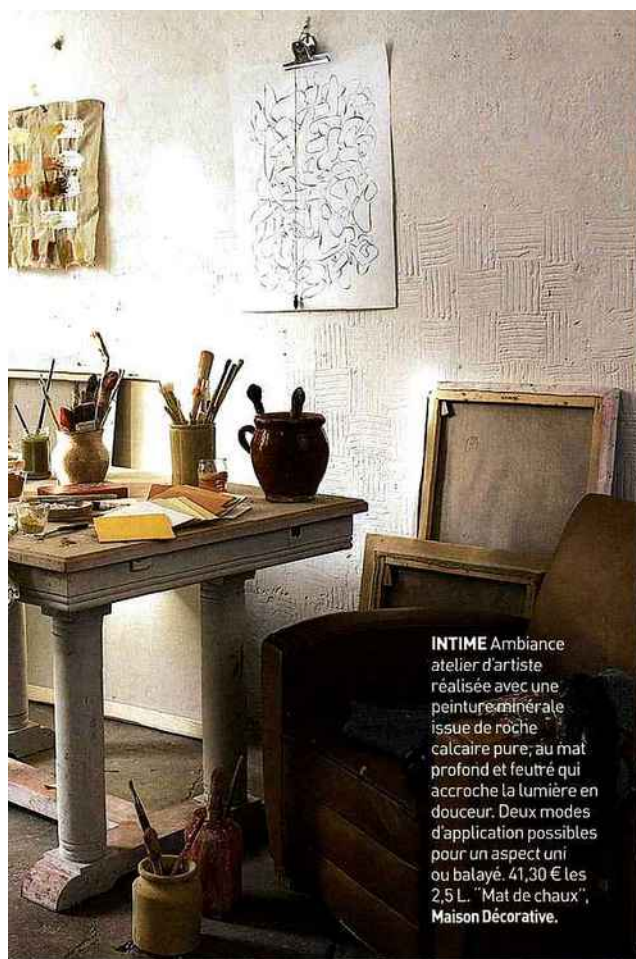
INTIME Ambiance atelier d'artiste réalisée avec une peinture minérale issue de roche calcaire pure, au mat profond et feutré qui accroche la lumière en douceur. Deux modes d'application possibles pour un aspect uni ou balayé. 41,30 € les 2,5 L. "Mat de chaux", Maison Décorative.